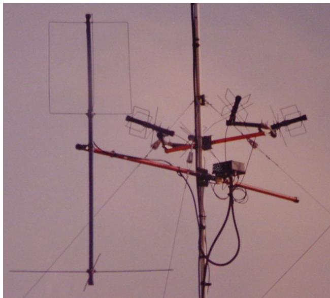
f) Eggbeater de VHF + 4*TPM2 de UHF