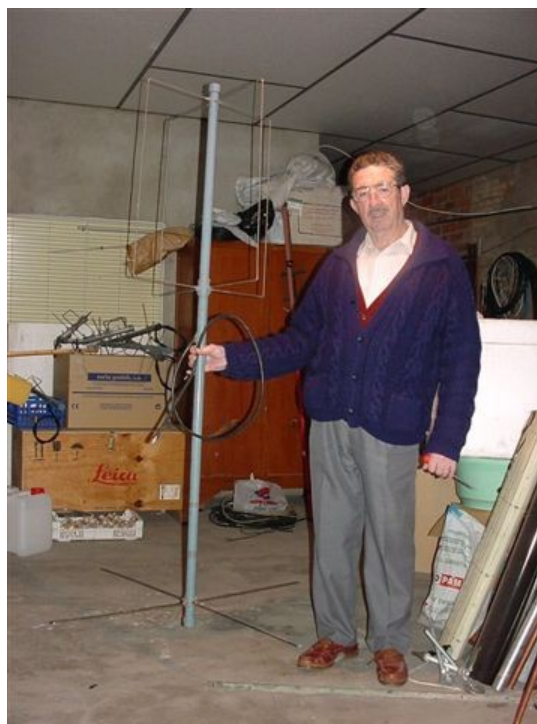
d) Eggbeater II de VHF + EA4ABV