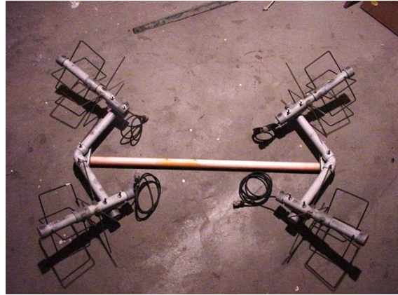
h) 4*TPM2 a 12° elevación Y 60° acimut