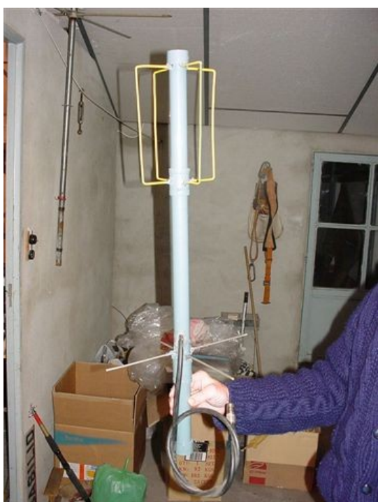
c) Eggbeater II de UHF

Aún así la antena me gustaba, pues la verdad es bonita, e hice una versión para VHF, y poder subir a los pajaritos. En VHF es una verdadera bomba, y no solo subiendo, sino la utilicé también para recibir los satélites meteorológicos, obteniendo resultados mucho mejor a los de la Turnstyle, sobre todo en ángulos bajos. Os puedo contar que como tiene polarización horizontal en el horizonte, posteriormente he trabajado estaciones en SSB terrestres a mas de 400 Km. sin estar estas en una sierra. Esta antena si me dio muchas satisfacciones.