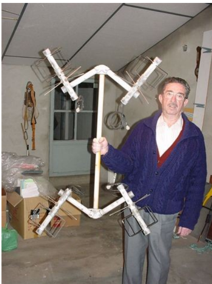
e) 4*TPM2 en la mano

De esta manera he estado trabajando 2 años con cientos de contactos en los satélites UO14, AO27 y SO35.