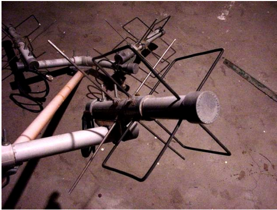
g) TPM2 de UHF